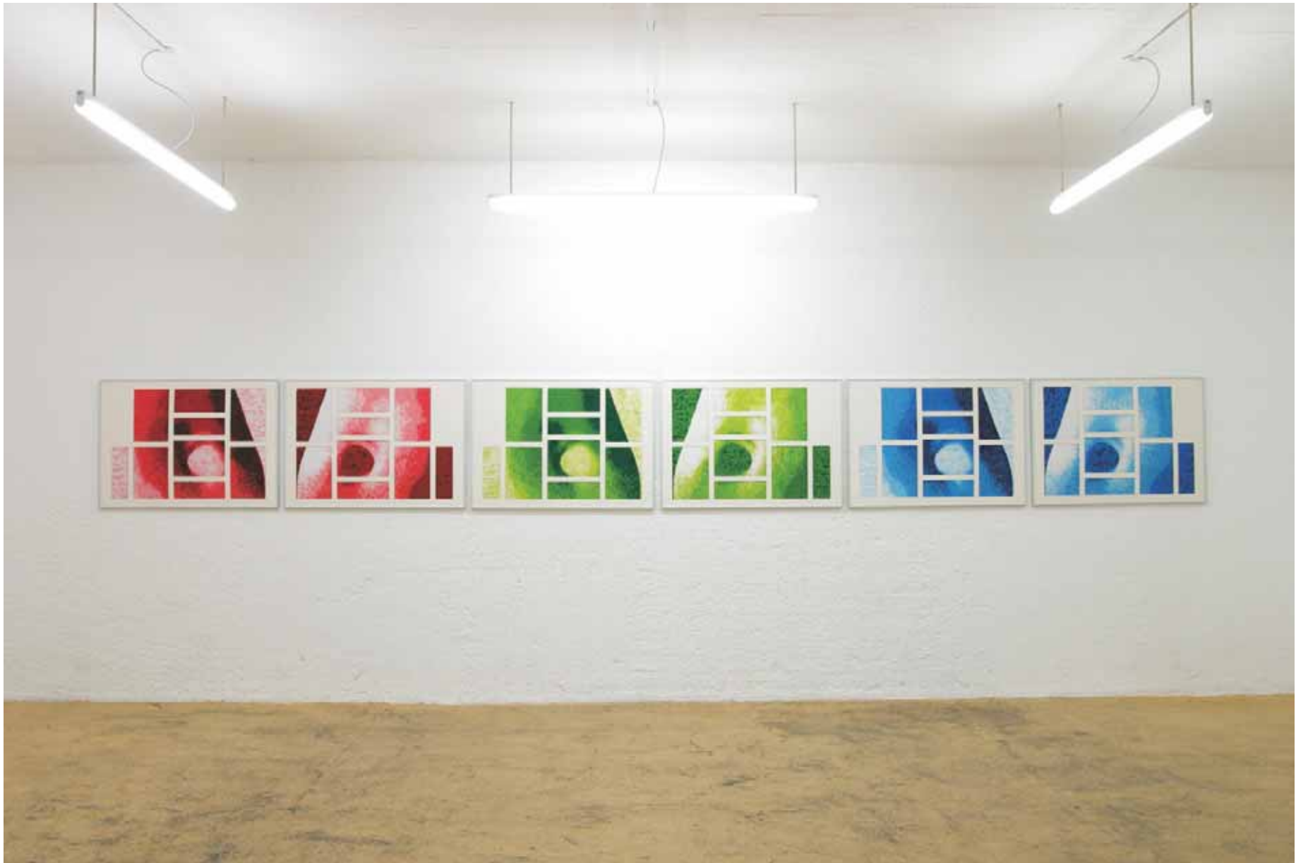
“Another Version Of Who Is Afraid Of Red Yellow and Blue” 2005 Tusche/Transparentpapier je 70*100 cm