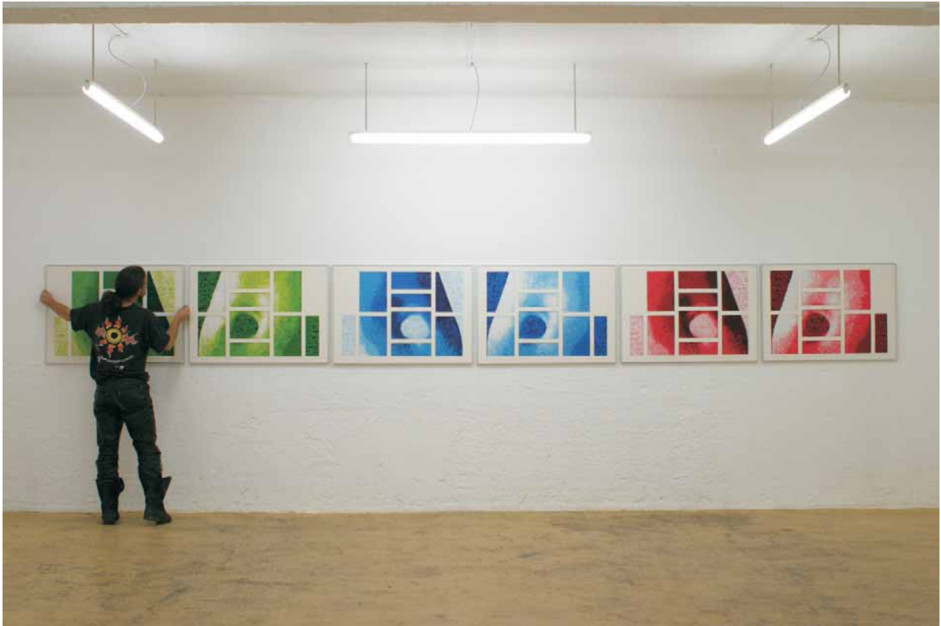
“Another Version Of Who Is Afraid Of Red Yellow and Blue” 2005 Tusche/Transparentpapier je 70*100 cm