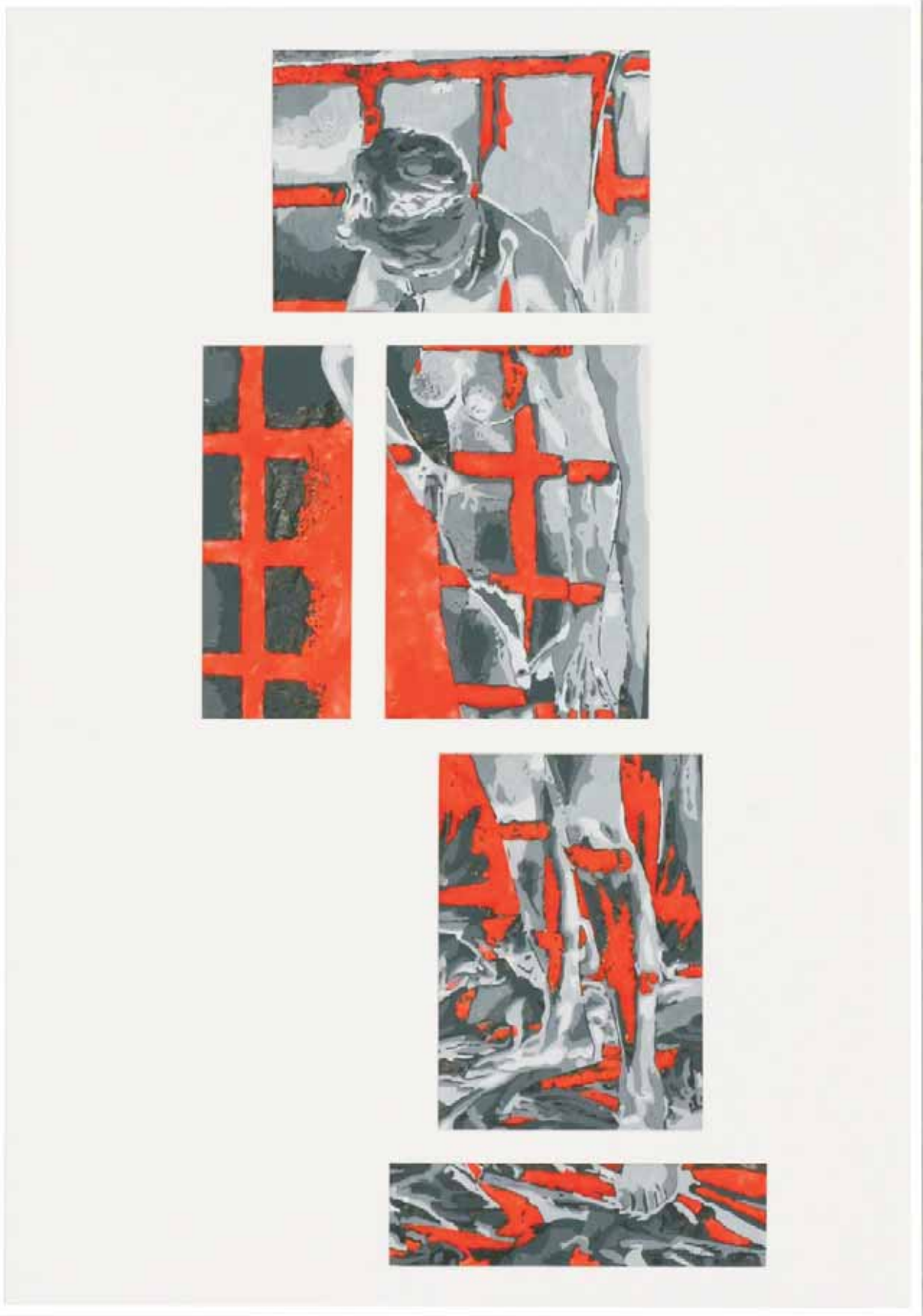
“Covering Light” 2004 Tusche/Transparentpapier 100*70 cm